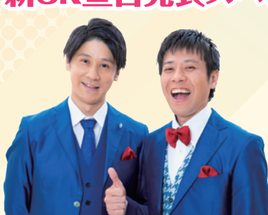
メインパーソナリティ スマイル