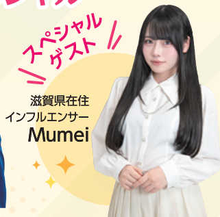
スペシャル ゲスト Mumei 滋賀県在住 インフルエンサー